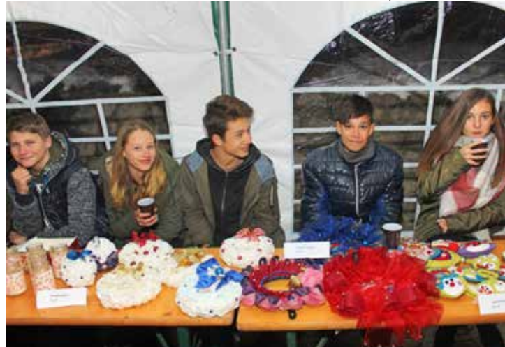
Výrobky žáků školy