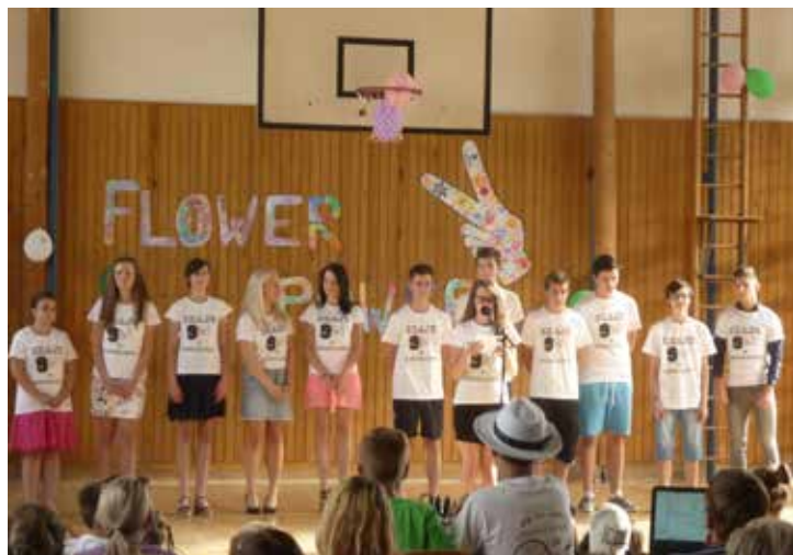
Školní akadémie 2017 žáci 9. třídy se loučí se školou