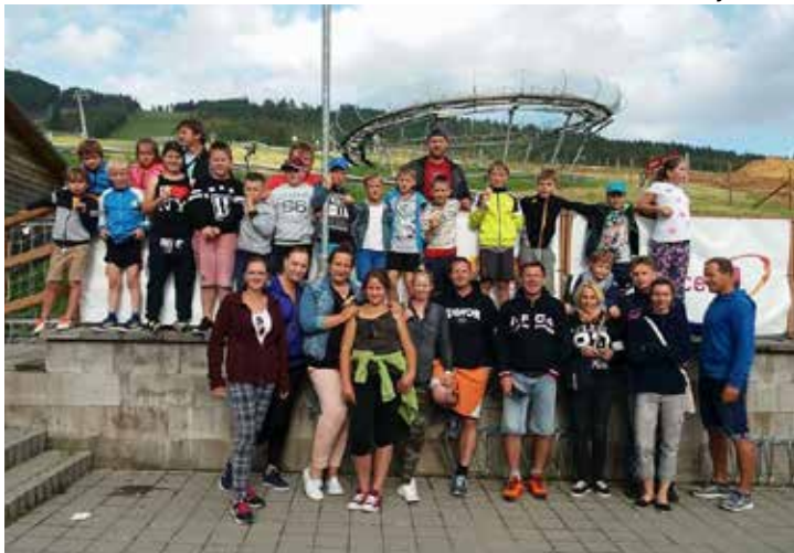
Výlet malých fotbalistů na Dolní Moravu