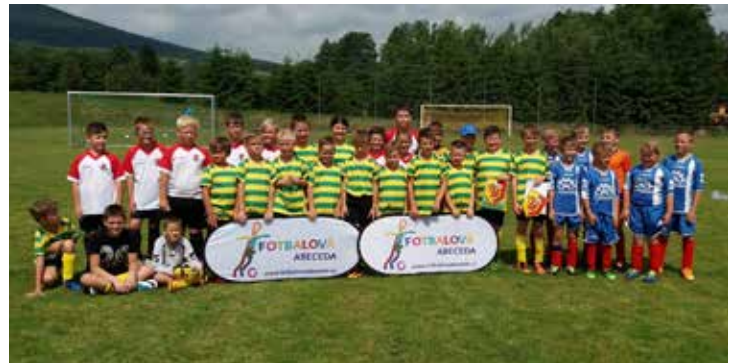
Zaječské fotbalové mláďi