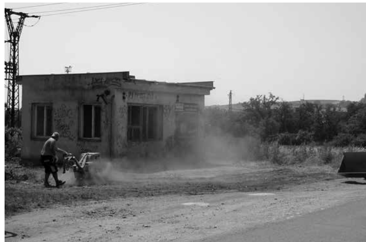
Úprava terénu - červen 2015