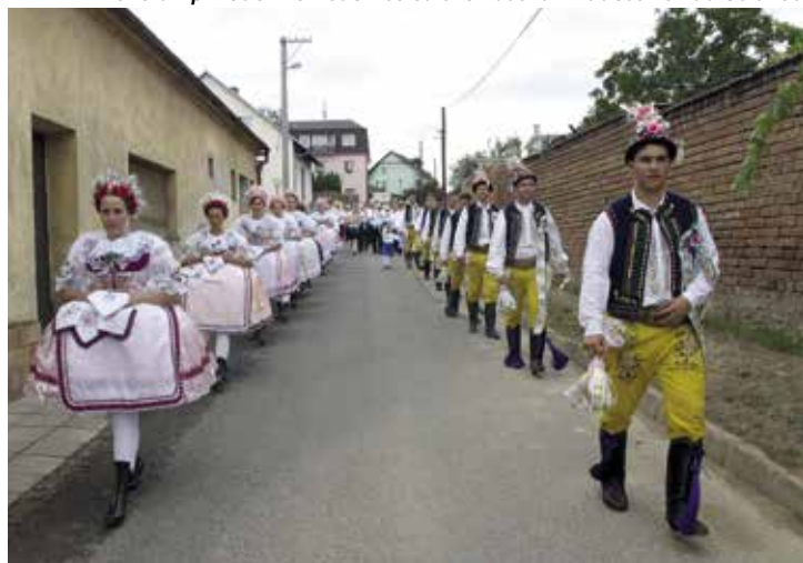
Průvod stárků 2014