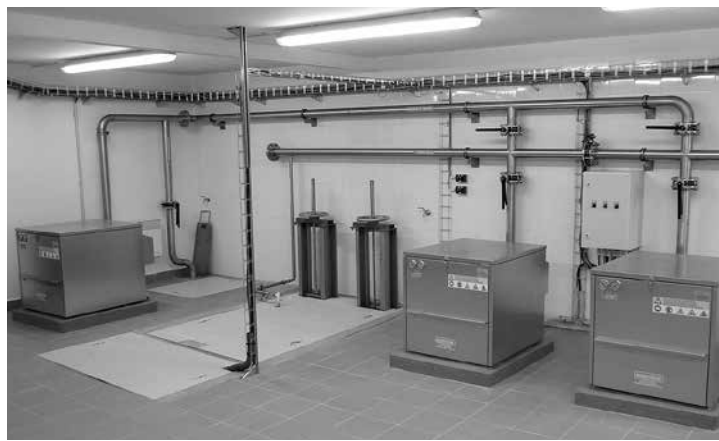
Technologie ČOV – rotační dmychadla – zdroj tlakového vzduchu pro biologický proces čištění

Pokud Vás zajímá chod zařízení ČOV, instalované zařízení a celá problematika čištění odpadních vod, přijďte na “Den otevřených dveří ČOV” , jehož termín bude s předstihem oznámen.