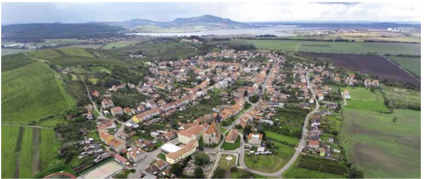
Letecký snímek Zaječín