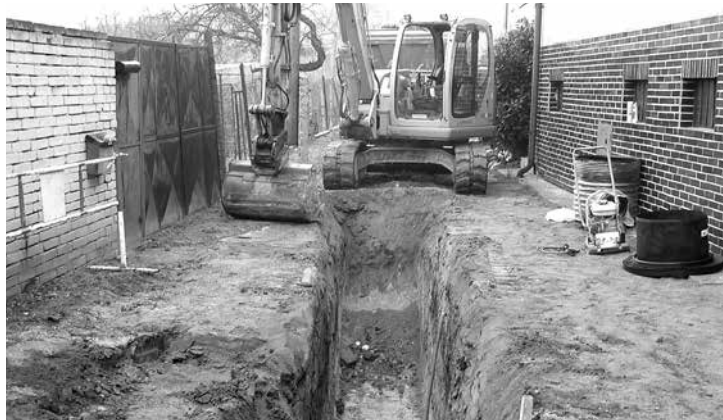
Výstavba kanalizace Šakvická - Vinařská

Nejdříve se budou připojovat domy na kanalizaci gravitační, tedy na tu, která teče samospádem do ČOV. To je od domů na ulicích Dlážďená, Břizová, Pod Vodojemem, Ulička, části ulic Dolní, Školní, Šakvická, Sadařská a část ulice Hlavní. V této oblasti - podle vývoje odstraňování vad a nedodělků - předpokládáme připojení domácností koncem června nebo v průběhu července ( přesný termín bude včas a patřičně oznámen ). Občané v dalších ulicích obce budou o možnosti připojení v dostatečném předstihu informováni až po zprovoznění jednotlivých čerpacích stanic nejpozději však, s ohledem na termín dokončení celé stavby, v průběhu září. Pro zkušební provoz nové čistírny odpadních vod bude potřeba na novou kanalizaci připojit co nejvíce domácností.