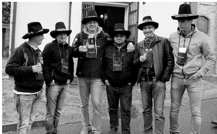
Otevřené sklepy na Vinařské