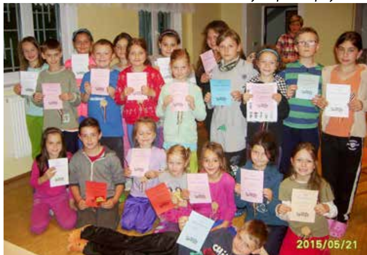
Škola v přírodě – rekreační středisko Záseka v Radostíně nad Oslavou