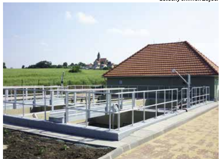
ČOV červen 2015