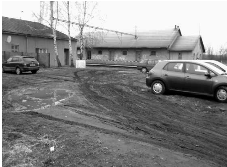
Parkovací plocha u nádraží

- účetní závěrku obce Zaječič za rok 2014