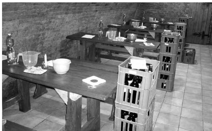
Vše je připraveno k hodnocení – přehledné seznamy, sklenice, voda i chléb a sýr

Poděkování patří všem vinařům za poskytnuté vzorky, degustátorům za odpovědné hodnocení vín a sponzorům za podporu této akce.