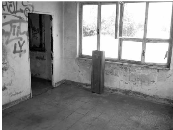
Po vyklizení - červen 2015