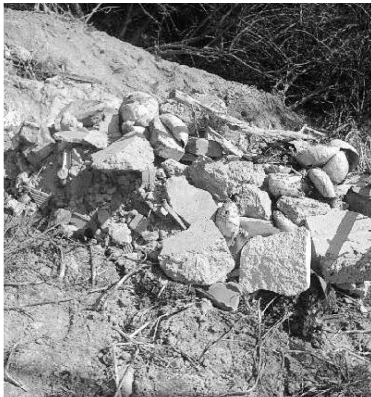
Suť na veřejném pozemku

nastala z důvodu přesné kontroly a adresnosti výsypu jednotlivých nádob. Tímto systémem bude možné obcím dodat přesné přehledy výsypu u každé nádoby. Nový systém evidence bude také pracovat i s naplněností nádob. Obec tak budou přesně vědět, která domácnost má kolik odpadů, a v které je třeba třídění odpadu zefektivnit.