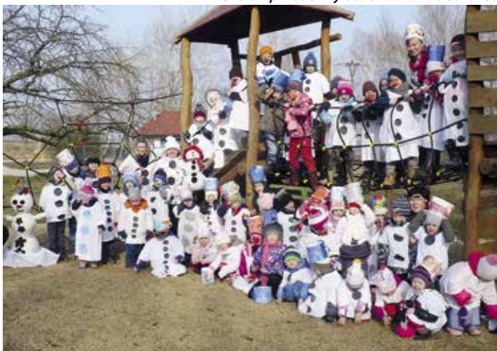
Sněhuláci pro Afriku