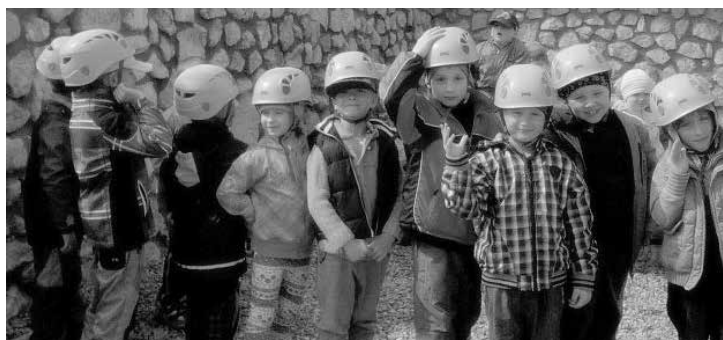
Z lanového centra