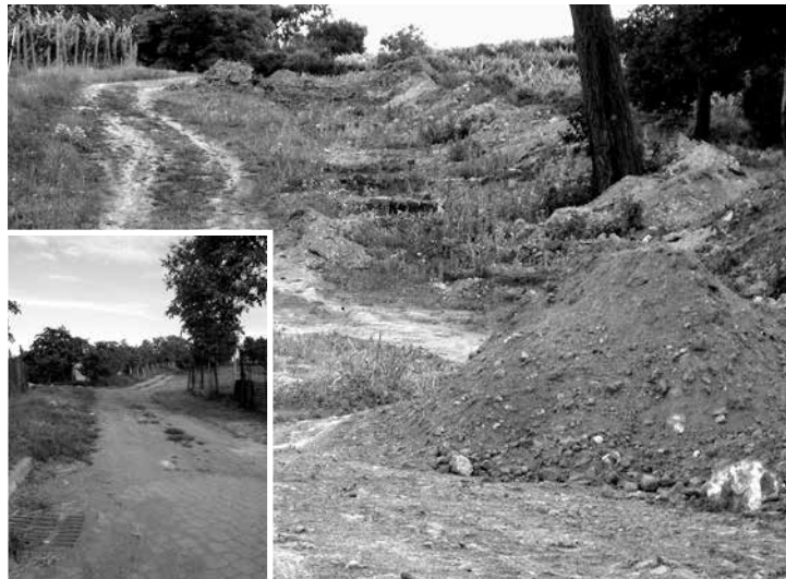
Oprava polních cest