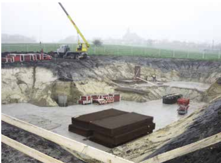
ČOV listopad 2014