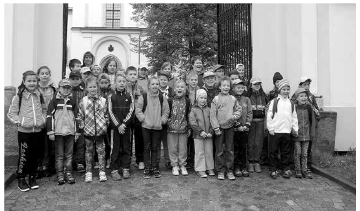
Výlet do Žďáru nad Sázavou

Také jsme byli na polodenním výletě ve Žďáru nad Sázavou a na Zelené hoře. Pro letošní školu v přírodě jsme vybrali krásné a čisté prostředí Českomoravské vysočiny v RS Záseka v Radostíně nad Oslavou, kde se dětem ulevilo od letos obzvlášť zaprášeného Zaječí. Děti se na školu v přírodě těšily a tak doufáme, že byly spokojené a budou na ni rády vzpomínat.