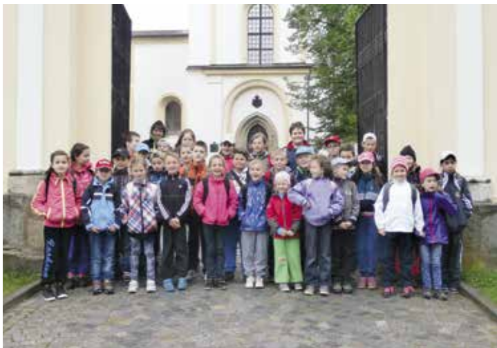
Škola v přírodě – výlet do Žďáru nad Sázavou