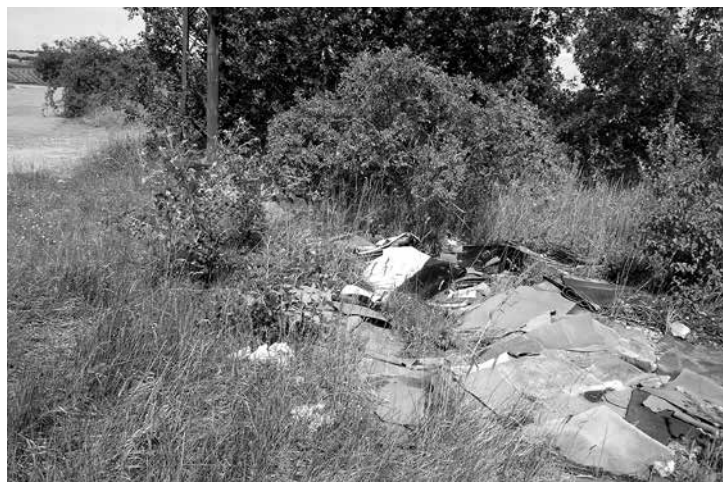
Černá skládka na parcele č. 5001/25 v k.ú. Zaječí