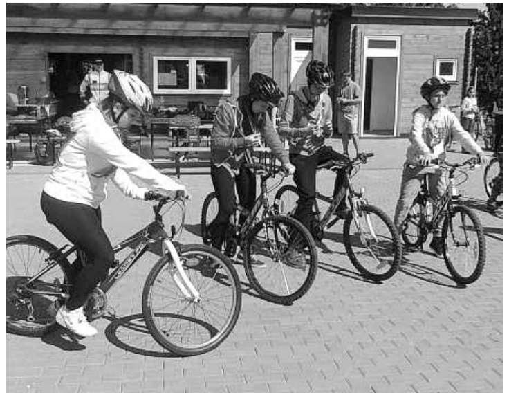
Na kole do Lednice