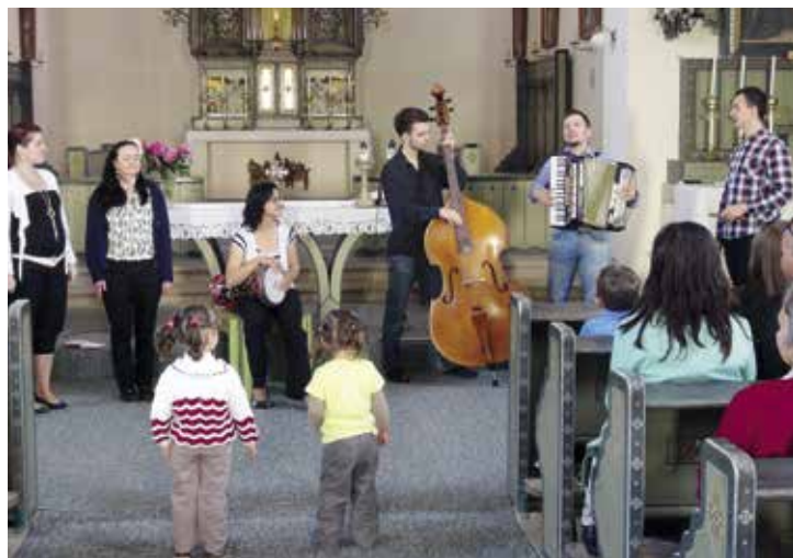
Noc kostelů – vystoupení skupiny AVLIJA