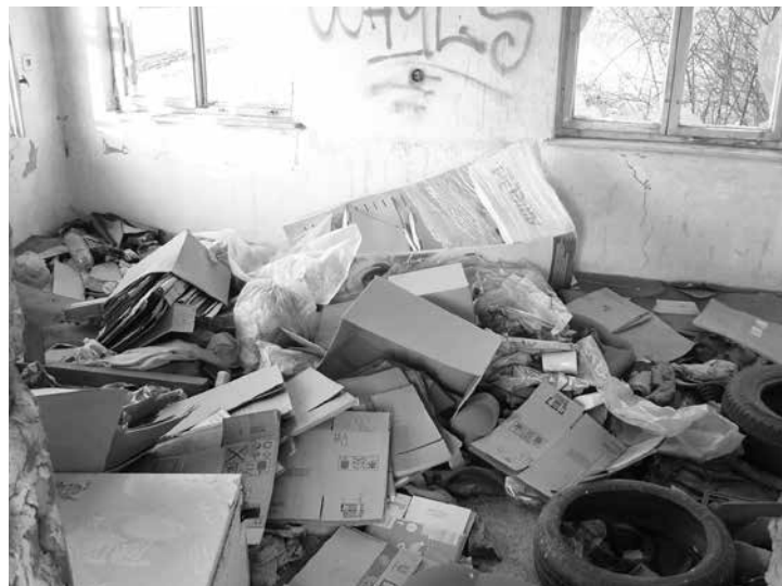
Vnitřní prostor váhy 2014