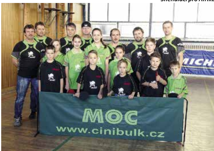
Oddíl stolního tenisu