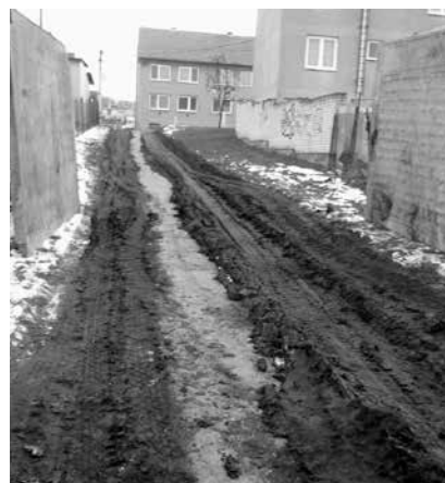
Důsledky stavební činnosti v obci

Budování čistírny odpadních vod (dále jen ČOV) a kanalizace v Zaječič se dostává do závěrečné fáze výstavby. Podle smlouvy o dílo se zhotovitelem stavby zbývají z celkových 420 dní na provedení stavby jen poslední tři měsíce. Na větší části obce je již kanalizace provedena, realizují se veřejné části kanalizačních přípojek a pokládka výtlačného potrubí od pěti čerpacích stanic, kterými budou znečištěné vody přečerpávány do gravitační kanalizace a samospádem budou odtékat do ČOV. Blíže byl celý systém odkanalizování obce popsán v předchozích vydáních Radničních listů.