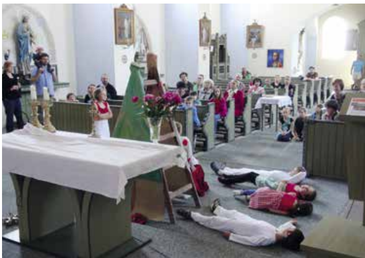
Noc kostelů – děti z dramatického oboru ZUŠ Břeclav