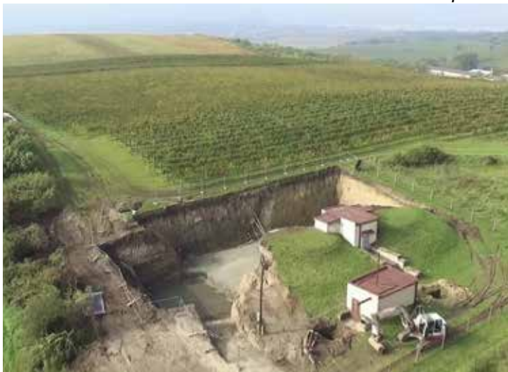
Výstavba nového vodojemu