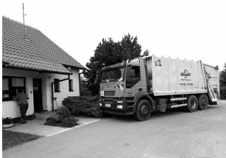
Svoz komunálního odpadu

Vzniklý kompost je certifikován jako průmyslové hnojivo a je možno ho zpět využít pro potřeby občanů obce.