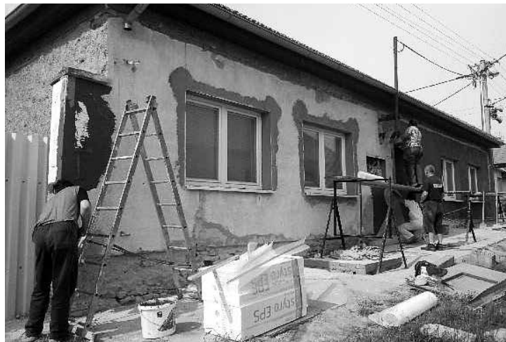
Klubovna rybářů na ulici Školní