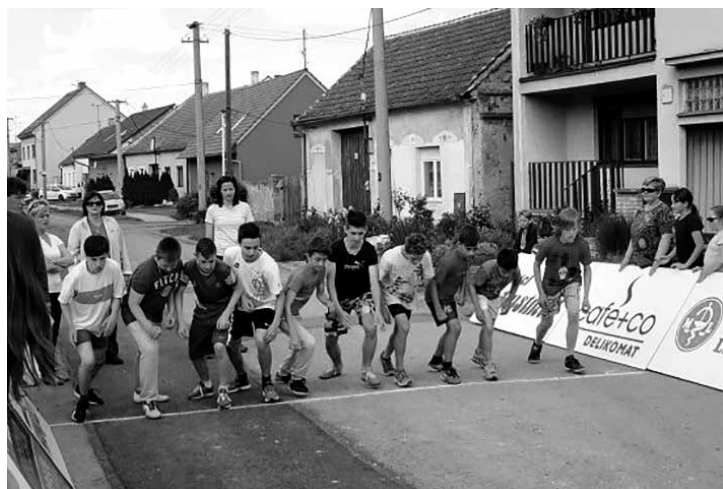
ZŠ na závodech - Dolní Věstonice

Přeji všem krásné léto, příjemné prožití dovolených a dětem šťastný vstup do nového školního roku.