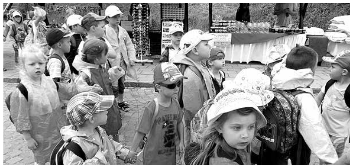
Výlet do Lednice

Na konci června jsme se rozloučili s našimi předškoláky ve školce také v rámci školní akademie. Děkujeme, že jste se na nás přišli podívat a oslavili s námi nejen konec školního roku, ale také začátek letních prázdnin.