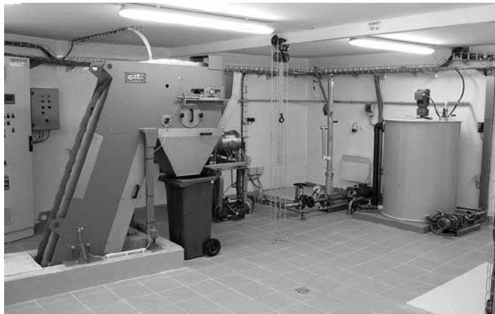
Technologie ČOV – strojní česle – zachycují nerozpuštěné látky a nečistoty

Čistírna odpadních vod je navržena na připojení 1750 obyvatel. Reálně lze předpokládat, že na konci zkušebního provozu přiteče na ČOV cca 120 m 3 /den. ČOV byla navržena a následně realizována jako mechanicko-biologická, kdy biologické procesy umožňují zejména odstranění organických látek, nerozpuštěných látek a dusíku. Po přítoku na ČOV jsou odpadní vody přečerpány na úroveň, která umožňuje její další průtok systémem čištění pouze gravitačně. Jako první dochází k průtoku odpadní vody přes mechanické čištění, které se skládá ze zařízení odstraňujících z odpadní vody hrubé nečistoty. Tato zařízení se nazývají lapák písků a česle. Zachycené hmoty jsou ukládány v kontejnerech a následně odvázeny na skládku odpadů HANTÁLY. Taktéž předčištěné splašky natékají gravitačně do biologické jednotky. V tomto hlavním objektu, který tvoří srdce celé čistírny dochází mikrobiální činností širokého spektra mikroorganismů k biochemickému rozkladu organického znečištění obsaženého v odpadní vodě. To vše za účinného promíchávání a provzdušňování. Provzdušňování aktivační směsi je nezbytné vzhledem k nutnosti zajištění životních podmínek přítomných mikroorganismů. Množství přiváděného vzduchu je regulováno