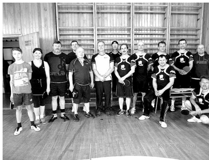
SK Zaječ úspěšná sezóna stolních tenistů

Už teď se těšíme na zahájení nové sezóny a na práci s našimi nejmladšími členy.