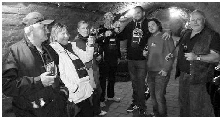
Otevřený sklep u Čermáků

Rok se s rokem sešel a naši obec čekal druhý ročník vinařské akce „Zaječské otevřené sklepy“. Intenzivní přípravy vyvrcholily v sobotu 23.5.2015. Všechny ubytovací kapacity nejen v obci, ale i v blízkém okolí, byly již dlouho předem zarezervovány a zájem o vstupenky v předprodeji naznačoval, že první ročník se povedl a premiéra zanechala pozitivní dojem nejen ve vinařích, ale především v návštěvnicích. Překročení magické hranice pětiset účastníků druhého ročníku je toho důkazem.